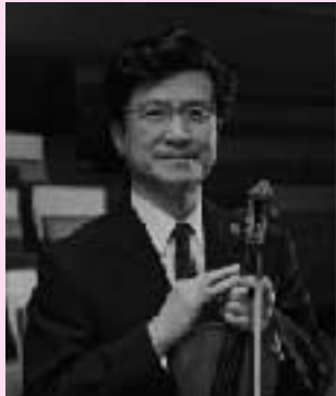
■ヴァイオリン © Perter Adamik